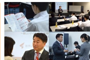
当日はたくさんの方にお集まりいただきました！